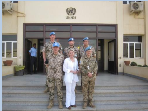
Vor dem UNMIS-Hauptquartier in Khartoum (Weihnachten 2010)

Wäre es anders gekommen, wenn die Begeisterung hierzulande ein südkoreanisches Niveau erreicht hätte mit einer landesweiten Zustimmung von mehr als 90 Prozent? Hatte München eine echte Chance oder musste Pyeongchang diesmal, im dritten Anlauf, einfach gewinnen? Auch hier gilt: Wer weiß und versteht, was das Internationale Olympische Komitee denkt und wünscht, der kann wahrscheinlich auch die Weltformel erklären oder besitzt eine sehr gute Glaskugel.