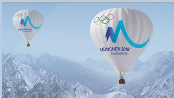
Eines der Münchner Bewerbungsfotos

wir Sportpolitiker waren in dieser Woche gedanklich – mancher Kollege auch geografisch – im südafrikanischen Durban. Dort wurden am Mittwochnachmittag die Olympischen Winterspiele 2018 vergeben. Es war ein Duell zwischen Deutschland und Südkorea, zwischen München und Pyeongchang. (Annecy aus Frankreich war nach einer pannenreichen Bewerbung kaum mehr als ein Zählkandidat.)