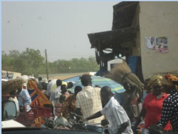
Straßenbild in Juba, der Hauptstadt des Südsudan

Mitglied Afrikas im Kreis der Vereinten Nationen.